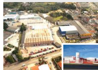
8. MONTANA INDÚSTRIA DE MÁQUINAS SAO JOSÉ DOS PINHAIS (BR) CASILDA - SANTA FE (AR)