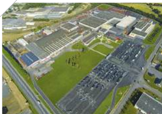
1. KUHN HUARD S.A. CHÂTEAUBRIANT (F)