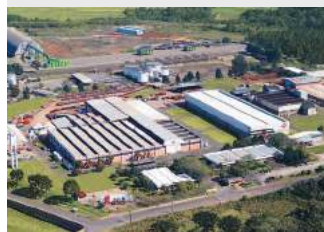
7. KUHN DO BRASIL PASSO FUNDO (BR)