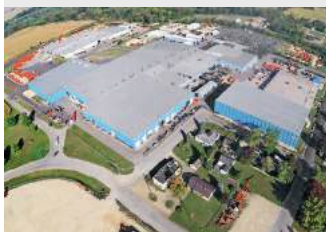
5. KUHN NORTH AMERICA INC. BRODHEAD, WI (USA)