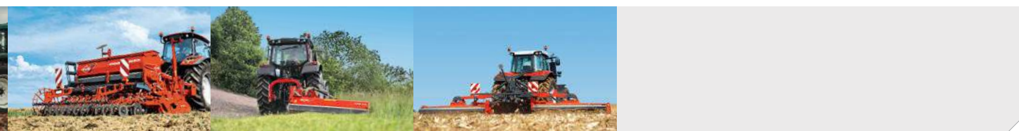
1. KUHN S.A. SAVERNE (F) 2. KUHN MGM SAS MONSWILLER (F) 3. KUHN PARTS MONSWILLER (F) 4. KUHN CENTER FOR PROGRESS MONSWILLER (F)