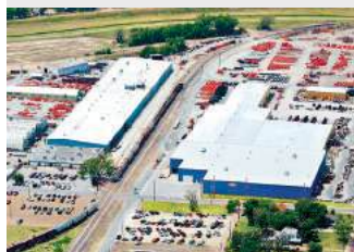
6. KUHN KRAUSE, INC. HUTCHINSON, KA (USA)