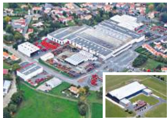
2. KUHN AUDUREAU S.A. LA COPECHAGNIÈRE (F)