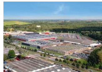
4. KUHN GELDROP B.V. GELDROP (NL)