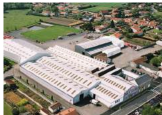
3. KUHN BLANCHARD S.A.S CHÉMÉRÉ (F)